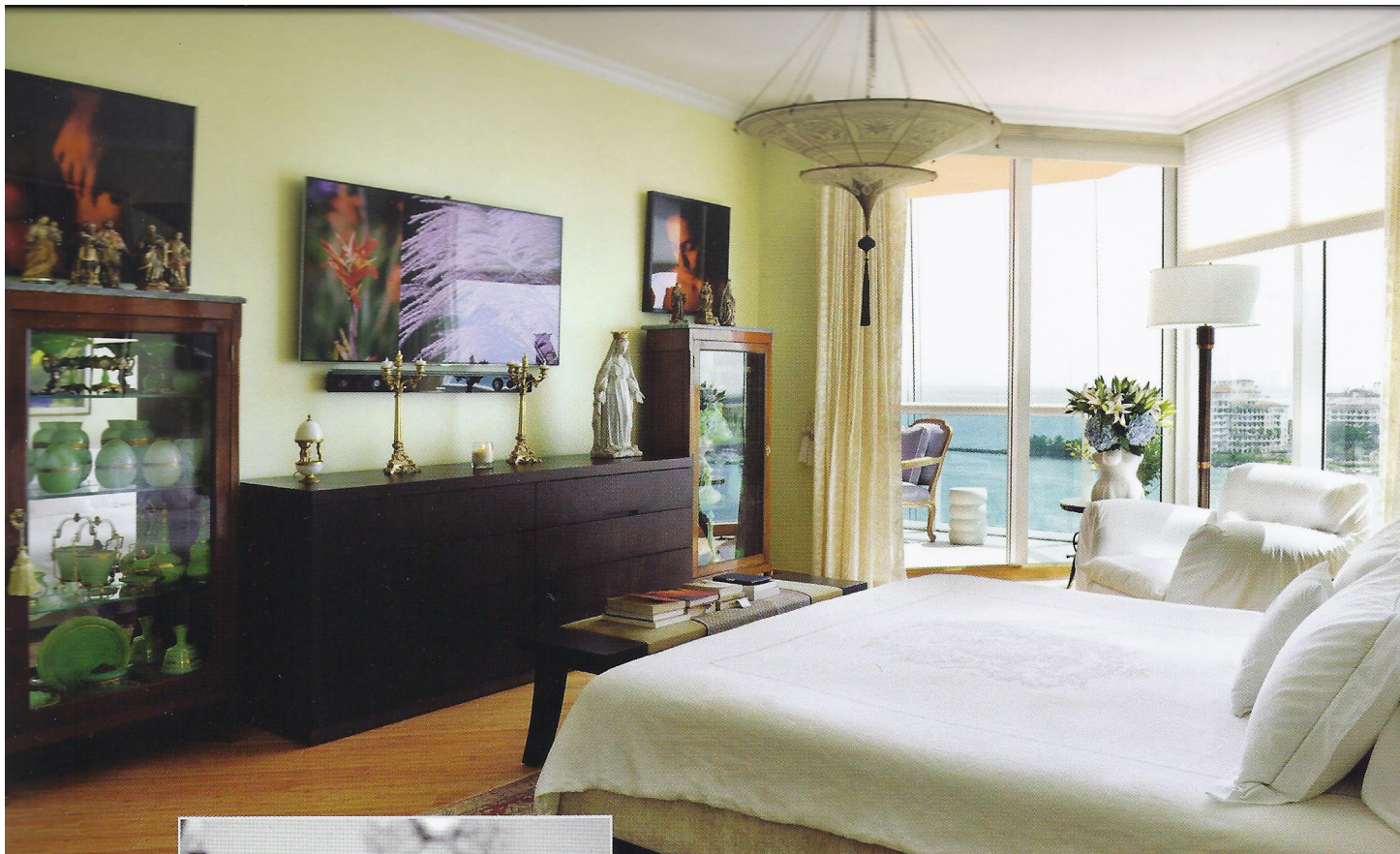
הגוונים בבית הוכתבו על ידי פרטי האוספים שהוסיפו למרקם העיצובי גוונים של תכלת וירקרק