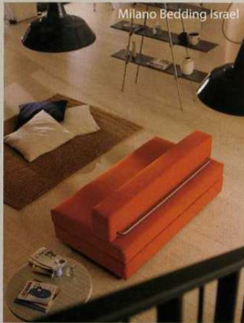
Milano Bedding Israel