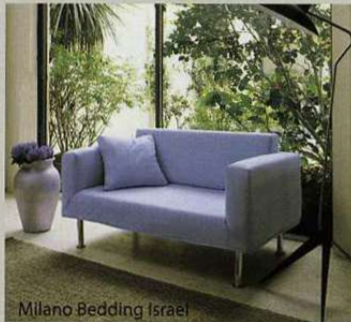
Milano Bedding Israel

מגדלי המגורים הצומחים במהירות מושכים בחזרה לערים אנשים שעברו לפני כמה שנים לפריפריה. בכניינים החדשים מחליפות את מרפסות השמש ויטרינות גדולות, שמכניסות פנימה אור ויצירות אשליה של מרחב למרות הצפיפות האורבנית.