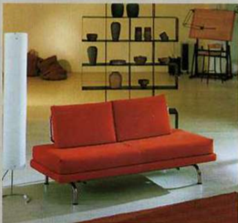
Milano Bedding Israel