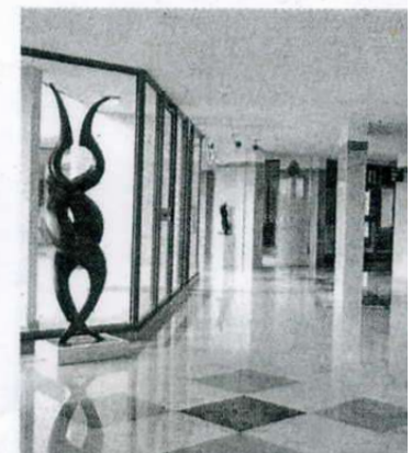
נגדלי נאמן בת"א (חברת "אזורים"). עיצוב של

ניפגש בלובי, זמנים מודרניים, ידיעות אחרונות, 27 ביולי 2005.