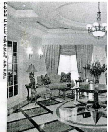
יוז מוגן בת"א. עיצוב של האדריכל יורם בר

את הלובי המפואר תכנן ועיצב האדריכל יוסי פרידמן, שהתמחה בתכנון מבואות כניסה לבנייני מגורים בארה"ב, בעיקר בניו-יורק ובמיאמי, במשך למעלה מ-20 שנה. לדבריו, חשוב ליצור במבואת כניסה סביבה אקלימית חדשה שתיתן לדיירים תחושה שהם כמעט בבית. "בסביבה עירונית בנייני המגורים יושבים על הרחוב ואין