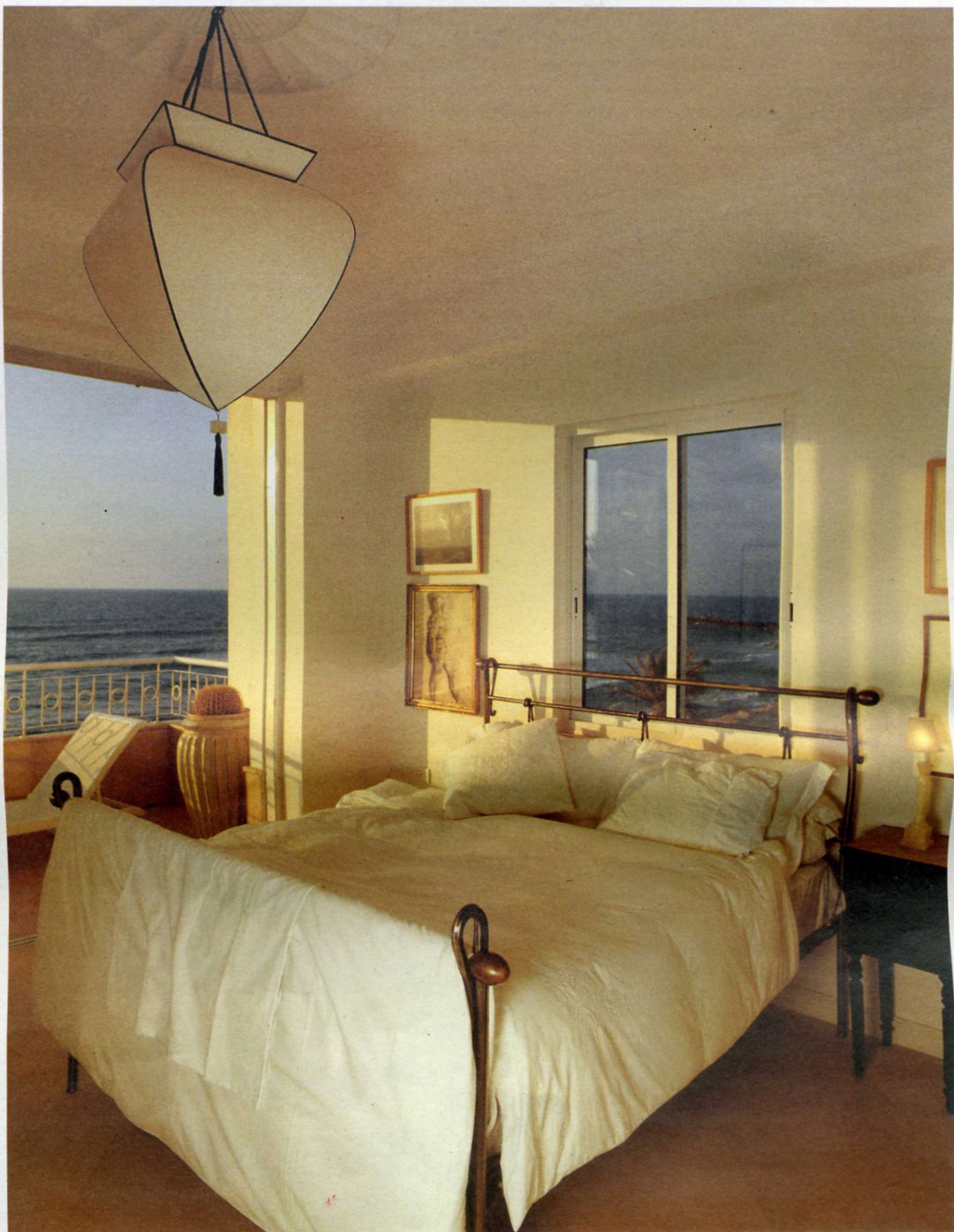
מימין: היציאה למרפסת. משמאל חדר השינה